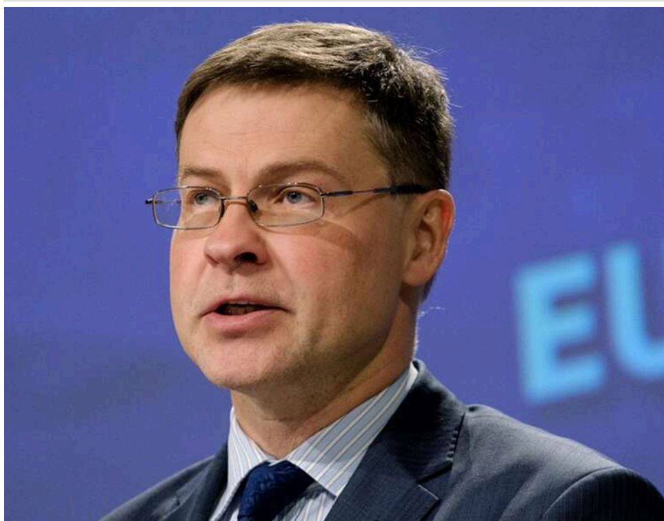
Податки в обмін на мільярди: Єврокомісар Домбровскіс назвав умови надання Україні подальшої макрофінансової допомоги

ЄС офіційно заявив: впровадження податкової реформи та зростання внутрішніх бюджетних доходів є обов'язковими для отримання Україною наступних траншів макрофінансової допомоги в межах кредитної програми на €90 млрд.