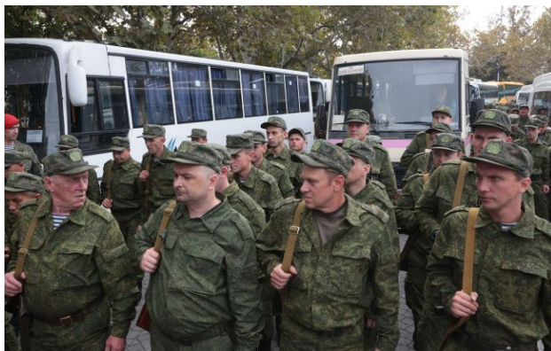
Фото: РФ розглядає нову хвилю відкритої мобілізації

Обирайте перевірене - додайте РБК-Україна до улюблених джерел у Google