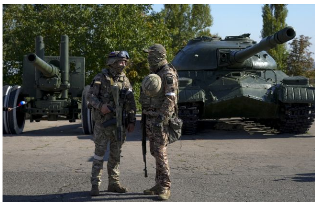
Фото: російські військові

Обирайте перевірене - додайте РБК-Україна до улюблених джерел у Google