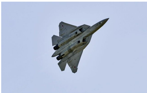
Фото: російський винищувач Су-57 (Getty Images)

У ГУР розкрили дані про понад сотню підприємств, залучених до виробництва російських винищувачів Су-57.