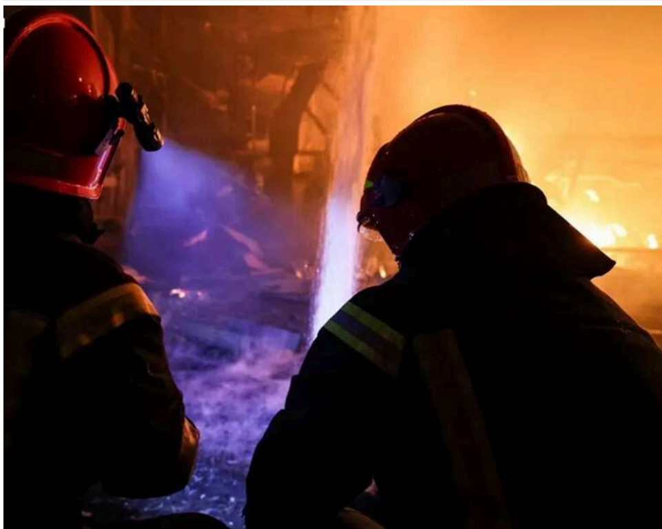
Загинули, рятуючи тепло для країни: "Нафтогаз" назвав імена газовиків, які стали жертвами нічної атаки на Полтавщині та Харківщині

У ніч проти 5 травня через російський обстріл газовидобувних об'єктів у Полтавській та Харківській областях загинуло троє співробітників НАК «Нафтогаз України». Вони разом із рятувальниками ДСНС прибули на місце, аби усунути наслідки першого удару росіян, проте в цей час ворог завдав повторної атаки чотирма ракетами.