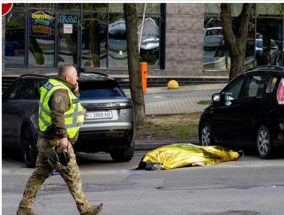
Трагедія в Голосіївському районі: кількість жертв зросла до семи, в лікарні помер чоловік

Кількість загиблих від теракту в Голосіївському районі Києва зросла до 7 осіб.