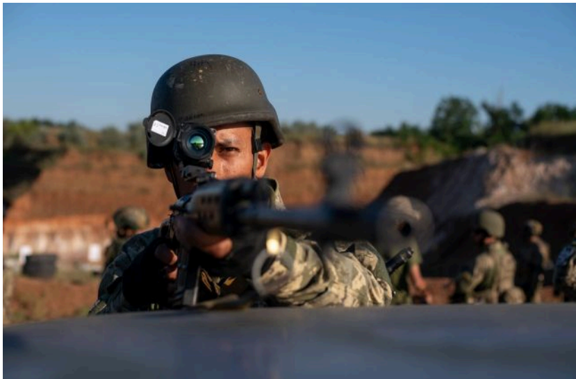
Ілюстративне фото: в Україні готують рекрутинг іноземців