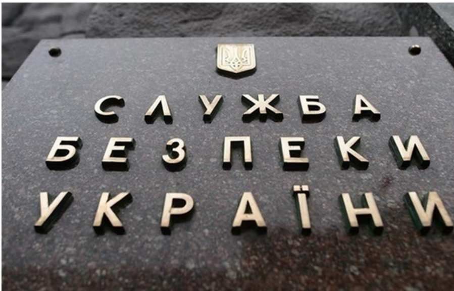
В СБУ повідомили подробиці справи

Для вчинення диверсії агент виготовив саморобні пристрої, які мали спричинити сходження з колії рухомого складу Укрзалізниці.