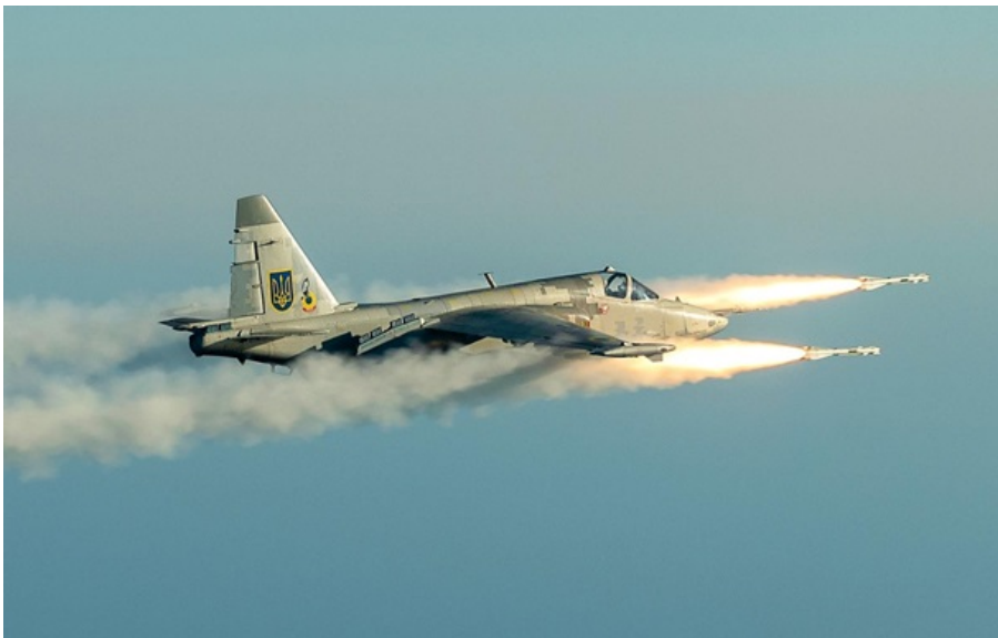
Штурмовик Су-25 завдає удару по російських окупантах

Найбільш активно ворог діє на Костянтинівському і Покровському напрямках. Але більшість атак вже захлинулась.