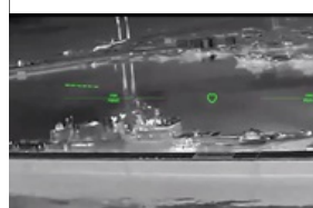
У Новоросійську уражено ракетний фрегат - Мадяр 6 квітня 2026, 14:18