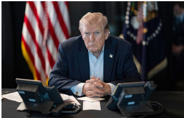
Фото: Дональд Трамп (Gettyimages)

Обирайте перевірене - додайте РБК-Україна до улюблених джерел у Google