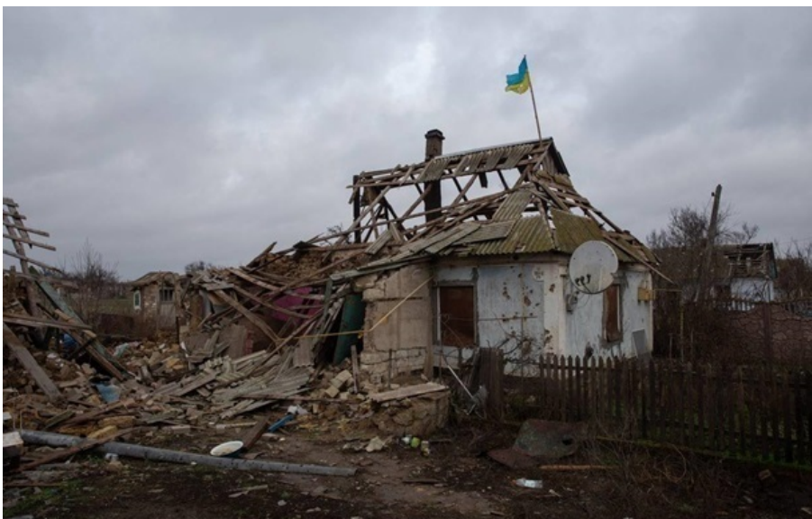
Економіка України у важкому стані через війну з Росією

Востаннє падіння економіки України було у першому кварталі 2023 року, але тоді масштаб був значно більшим.