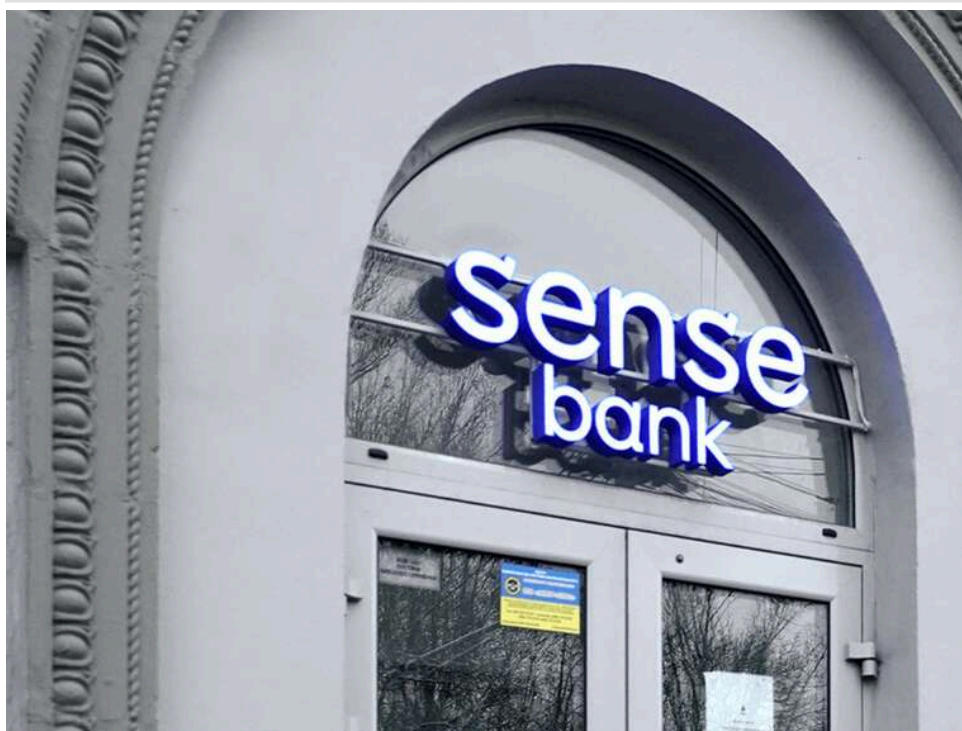
"Сенс Банк" у центрі корупційного скандалу: Гетманцев заявив про нелегальні схеми в гральному бізнесі

Гетманцев заявив, що в державному Сенс Банку могла діяти організована група, яка через службові повноваження забезпечувала проведення нелегальних платежів у сфері азартних ігор.