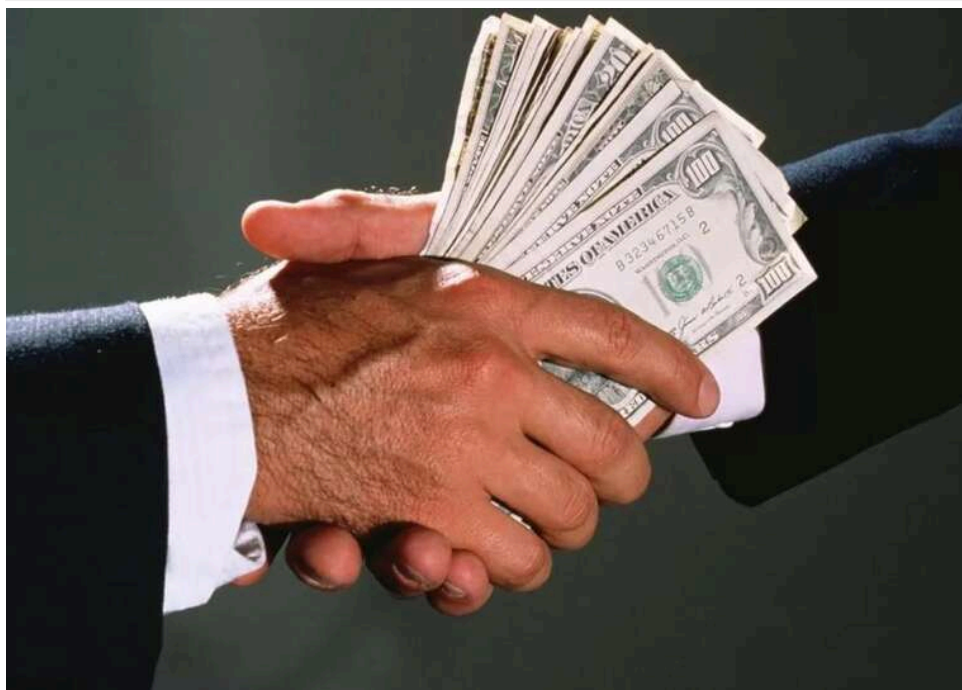
В Одесі експосадовця ДФС засудили до 5 років в'язниці за вимагання хабарів з імпортерів

На Одещині колишнього посадовця податкової міліції засудили до 5 років ув'язнення за систематичне отримання хабарів від імпортерів.