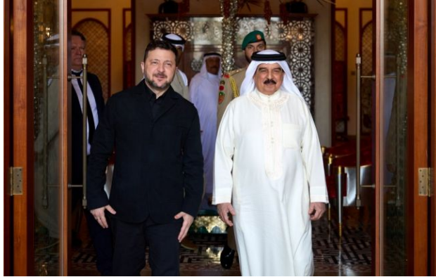
Фото: Володимир Зеленський і Хамад ібн Іса Аль Халіфа

Обирайте перевірене - додайте РБК-Україна до улюблених джерел у Google