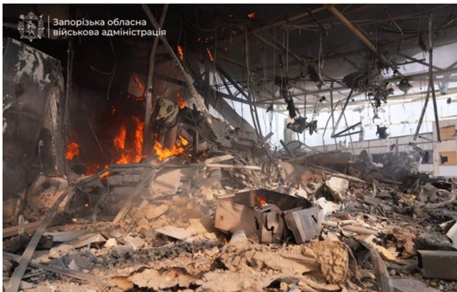
Росіяни вдарили по Запоріжжю

Горять автомобілі, магазин та підприємство. У Запоріжжі вже вісім поранених. Дві людини загинули.