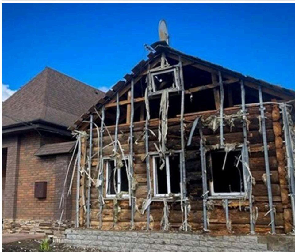
Масований обстріл Сумщини: поранені двоє пенсіонерів, під ударом опинилися 27 населених пунктів

Протягом доби, 19 квітня 2026 року, російські окупанти обстріляли 39 разів 27 населених пунктів Сумської області. Обстріли зафіксовано в Сумському, Шосткинському, Охтирському та Роменському районах. Ворог використав керовані авіабомби, ударні та FPV-дрони, міномети й артилерію.