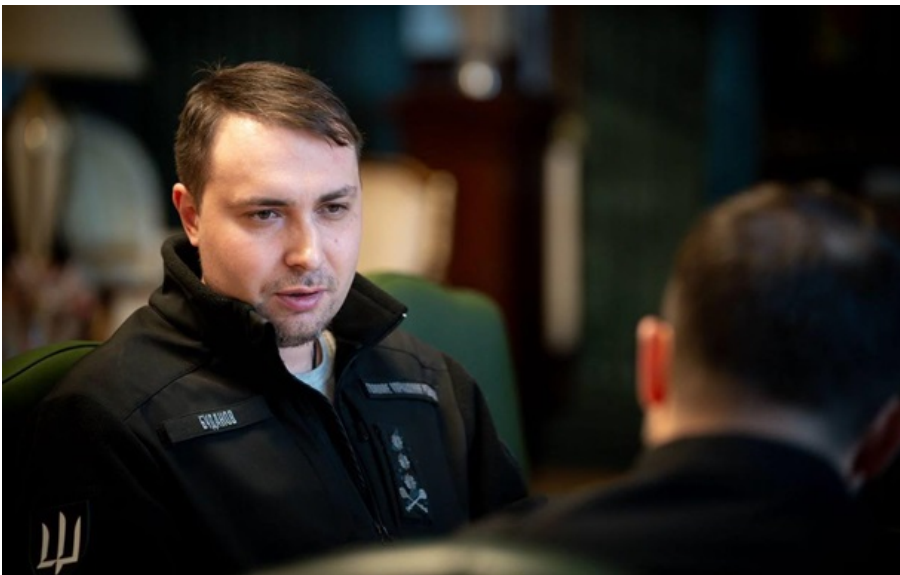
Зеленський і Буданов під час наради

Україна запровадила перемир'я не у прив'язці до якихось дат, а заради збереження людського життя та відновлення безпеки, зазначив Кирило Буданов.