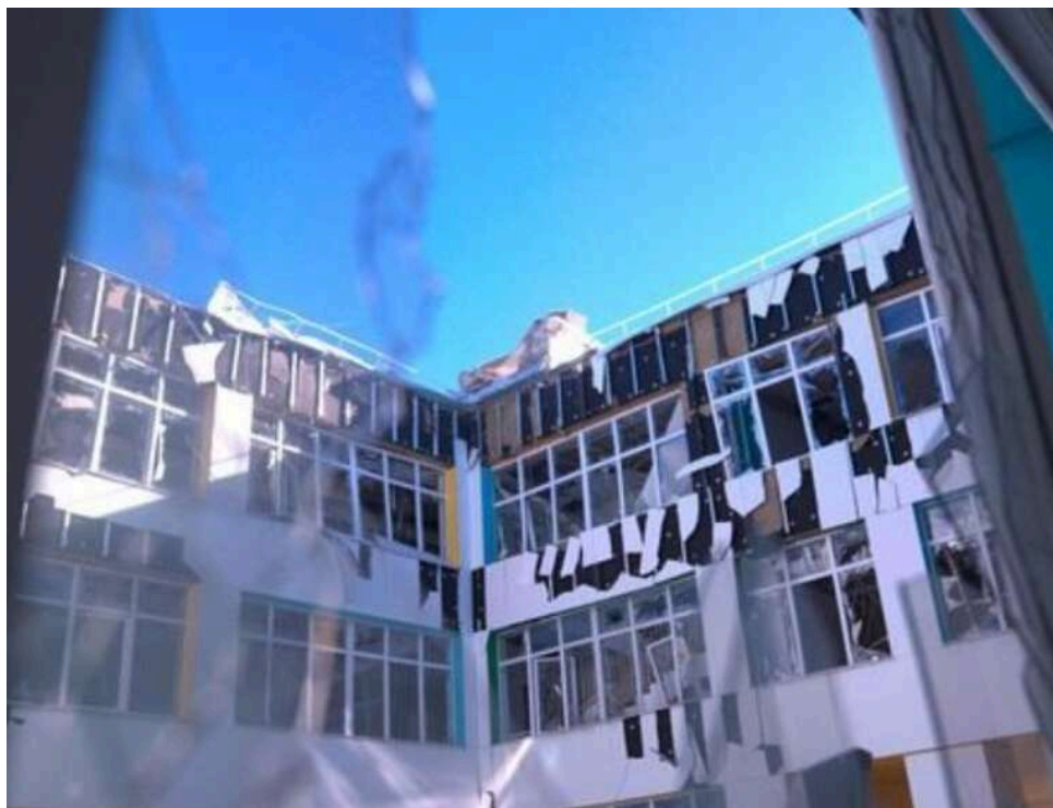
Мільярди під уламками: як відбудова прифронтової Харківщини перетворилася на «будівельне казино»

Харківщина звикає до примусової евакуації та щоденних КАБів, а місцева влада продовжує грати в «будівельне казино» з державною скарбницею.