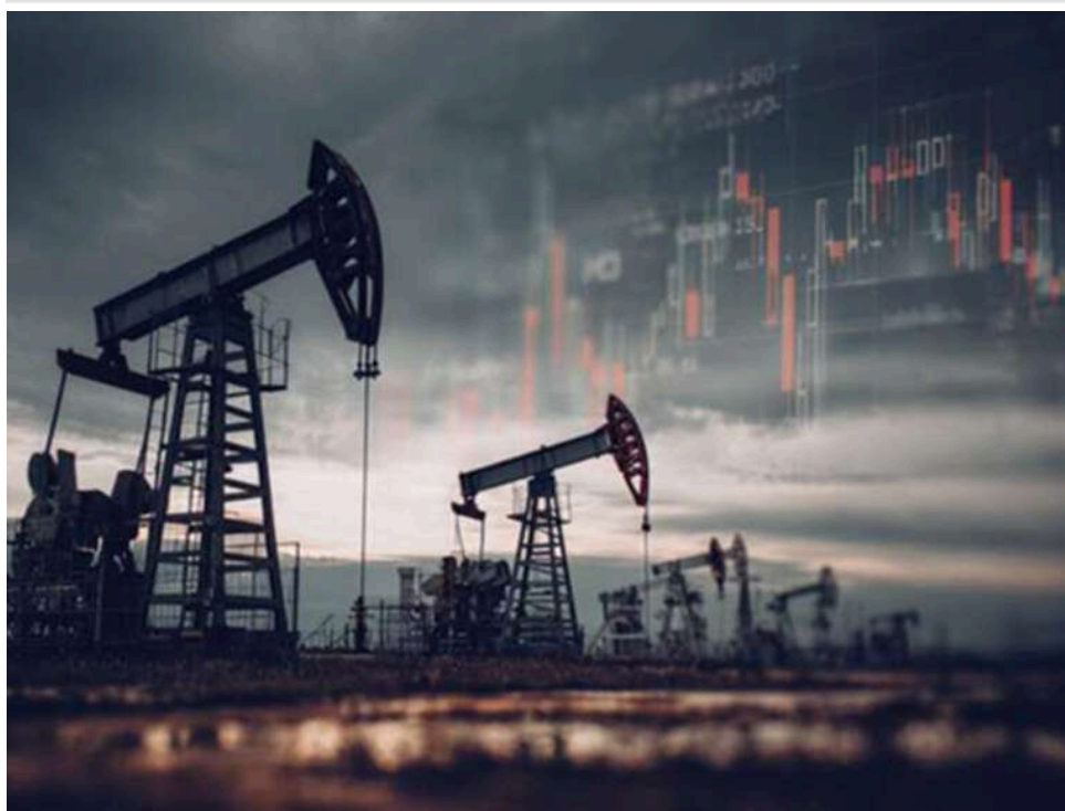
Нафта по 95 доларів і дорогий газ: ринки відреагували різким зростанням на зіткнення США та Ірану

Нафтові котурування значно підскочили після удару ВМС США по іранському судну та повторного запровадження Тегераном обмежень в Ормузькій протоці, повідомляє Bloomberg.