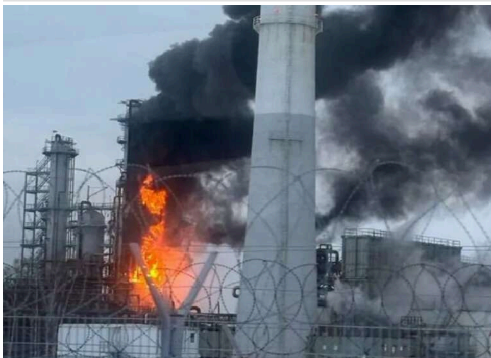
Удар по бюджету війни: СБУ атакувала один із найбільших НПЗ Росії в Ленінградській області

Виконуючи поставлені Президентом України завдання, бійці «Альфи» СБУ спільно із Силами оборони (ССО та СБС) провели успішне ураження об'єктів нафтоінфраструктури в Ленінградській області РФ. «Бавовна» палає на НПЗ «Кірішінафтооргсинтез», а також на нафтоперекачувальній станції «Кіріши».