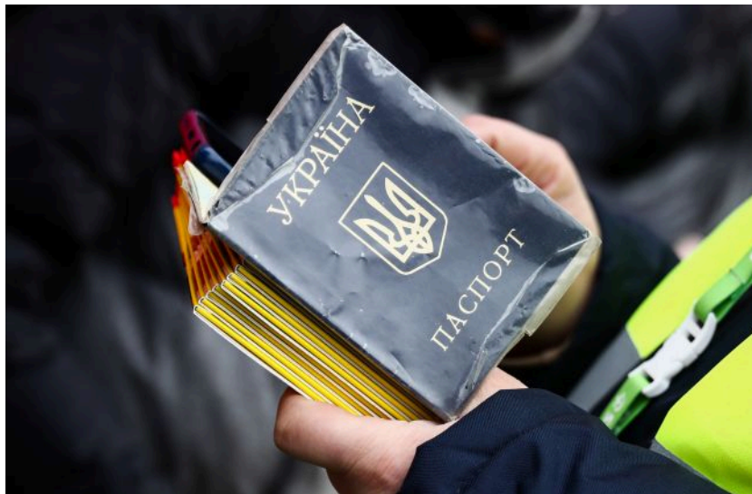
Чи можна користуватися затертим або порваним паспортом - важливе питання

Обирайте перевірене - додайте РБК-Україна до улюблених джерел у Google