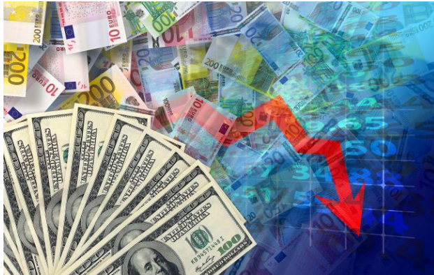
Фото: НБУ оновив офіційний курс валют на 6 травня (Getty Images)

Обирайте перевірене - додайте РБК-Україна до улюблених джерел у Google