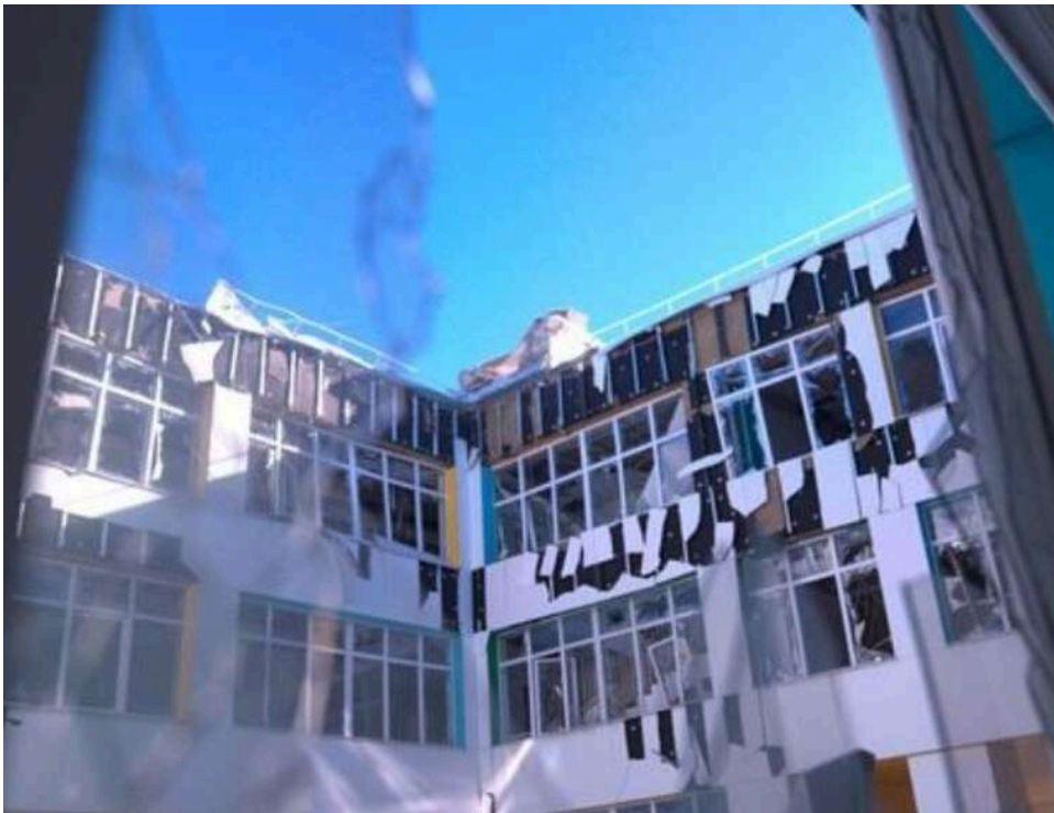
Мільярди під уламками: як відбудова прифронтової Харківщини перетворилася на «будівельне казино»

Харківщина звикає до примусової евакуації та щоденних КАБів, а місцева влада продовжує грати в «будівельне казино» з державною скарбницею.