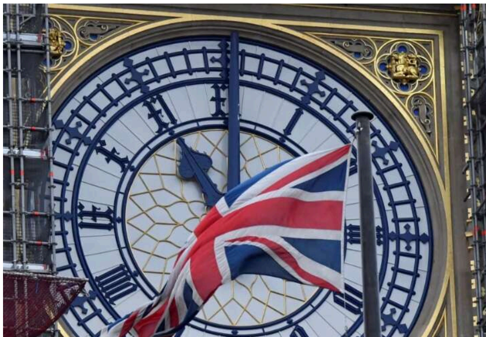
Велика Британія запровадила санкції проти 35 осіб і компаній за вербування мігрантів для війни РФ

У вівторок, 5 травня, Велика Британія оголосила про введення санкцій проти 35 осіб та організацій, які причетні до вербування вразливих мігрантів для участі у війні Росії в Україні та виробництва дронів для використання у війні.