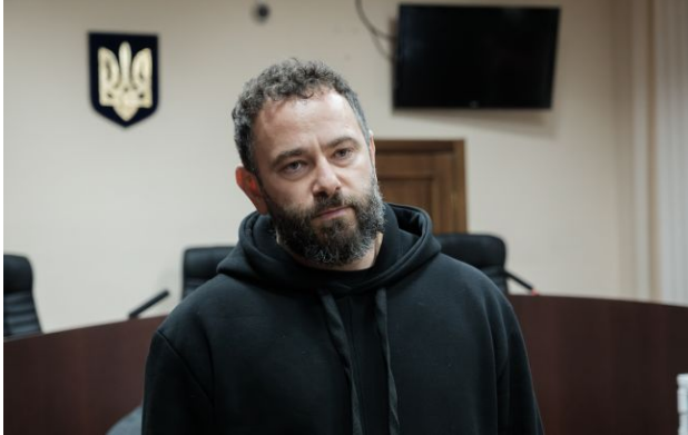
Фото: народний депутат Олександр Дубінський

Обирайте перевірене - додайте РБК-Україна до улюблених джерел у Google