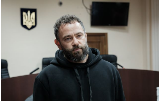
Фото: народний депутат Олександр Дубінський

Обирайте перевірене - додайте РБК-Україна до улюблених джерел у Google