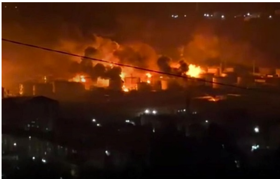
Пожежа в Туапсе після атаки дронів

Комплексне ураження портової інфраструктури Туапсе та Туапсинського НПЗ відбулось у квітні і 1 травня.