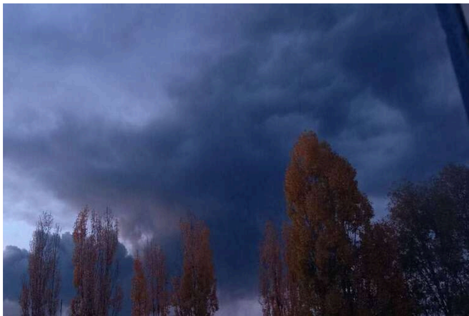
Генштаб ЗСУ повідомив про ураження заводу «ВНІІР-Прогрес» і НПЗ у РФ

Генеральний штаб Збройних Сил України повідомив про ураження підприємства військово-промислового комплексу «ВНІІР-Прогрес» та нафтопереробного заводу «Кірішський» на території Росії й низки об'єктів противника на тимчасово окупованій території України.