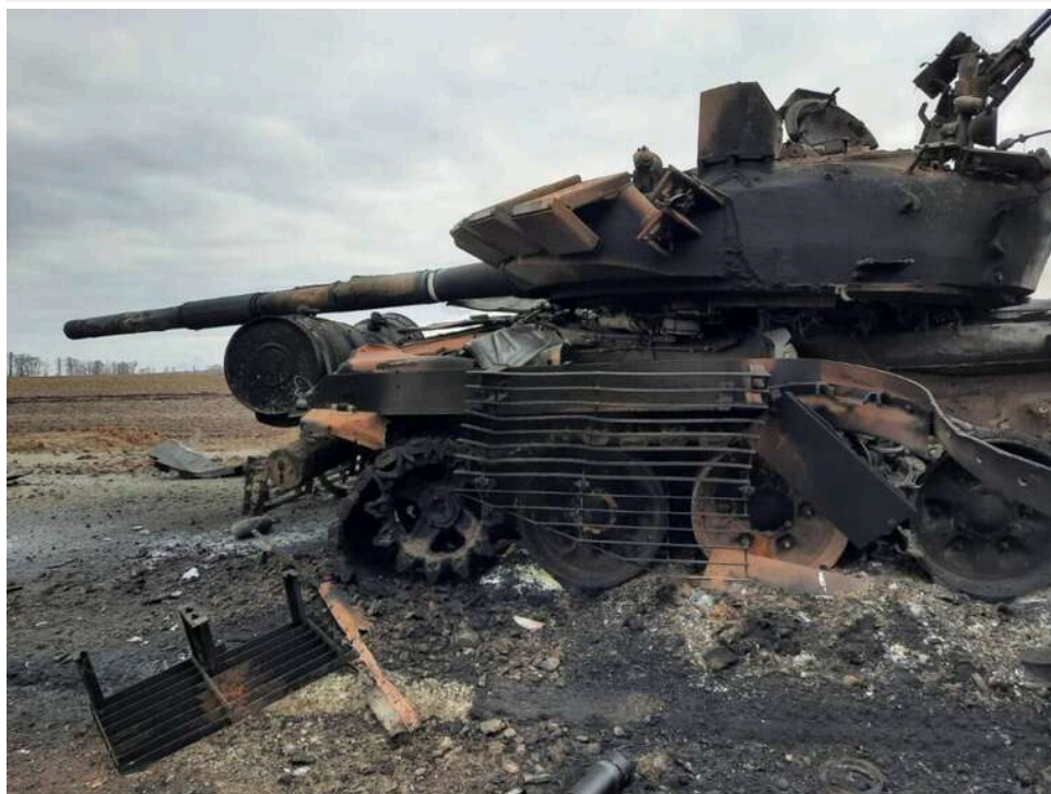
Втрати ворога за добу: ЗСУ знешкодили 920 окупантів і 4 танки

Сили оборони України за минулу добу зменшили чисельність російської окупаційної армії на 920 окупантів. Загалом бойові втрати росіян у живій силі досягли 1 342 030 осіб.