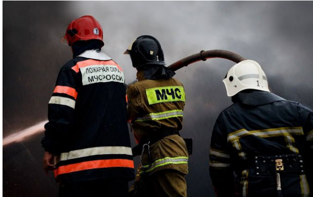
Фото: внаслідок удару дронів на НПЗ та НПС у Ленінградській області спалахнули пожежі

Обирайте перевірене - додайте РБК-Україна до улюблених джерел у Google