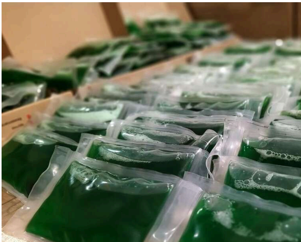
Грілки по-новому: «Агенція оборонних закупівель» переплатить 45% за хімічні грілки після розриву попереднього контракту

ДП МОУ «Агенція оборонних закупівель» 29 квітня за результатом торгів замовило ТОВ «Сіріус-О» постачання засобів індивідуального обігріву на 15,3 млн грн.