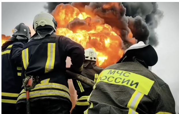
Фото ілюстративне: у Росії пожежу на великому НПЗ у Кірішах видно з супутника (скрін з відео)

Обирайте перевірене - додайте РБК-Україна до улюблених джерел у Google