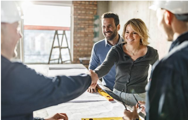
Фото: нерухомість та валюта залишаються базовими інструментами збереження заощаджень

Обирайте перевірене - додайте РБК-Україна до улюблених джерел у Google