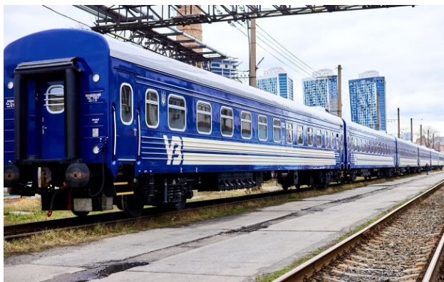
Фото: "Укрзалізниця" запускає оновлені вагони (facebook.com/Ukrzaliznytsia)

Обирайте перевірене - додайте РБК-Україна до улюблених джерел у Google