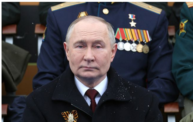
Фото: глава Кремля Володимир Путін

Обирайте перевірене - додайте РБК-Україна до улюблених джерел у Google