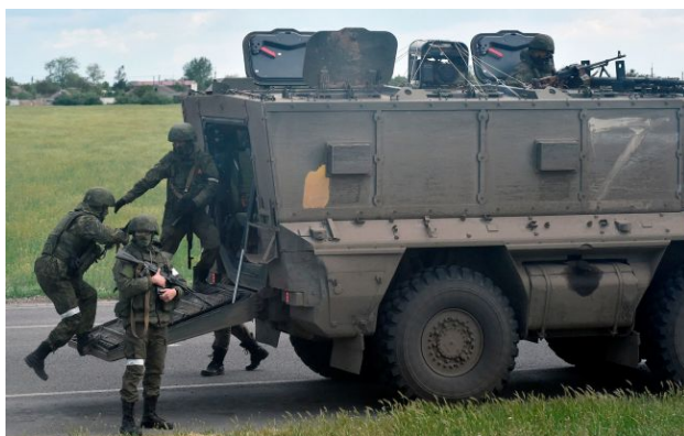
Фото: Чому Росія маніпулює темою Нарві: пояснення естонського Міноборони

Міноборони Естонії назвали розмови про загрозу Нарві навмисною провокацією Москви - простим і дешевим інструментом для розколу суспільства.