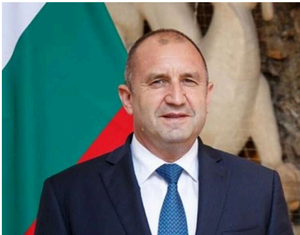
Реванш Румена Радева: проросійська коаліція впевнено перемагає на виборах у Болгарії

На парламентських виборах у Болгарії лідирує партія експрезидента Радева, який виступає за відновлення зв'язків з Росією.