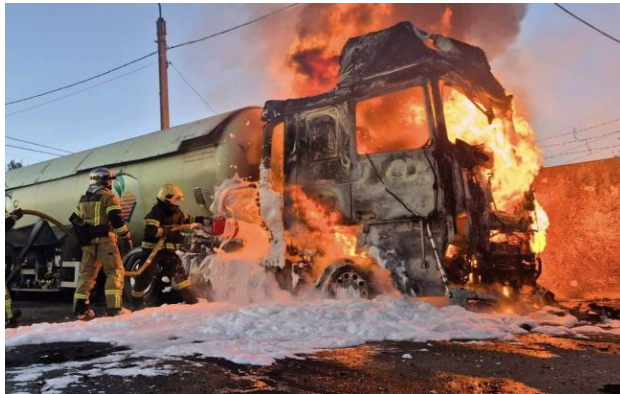
Фото: в ніч на 5 травня Росія масовано атакувала Україну дронами та ракетами

Обирайте перевірене - додайте РБК-Україна до улюблених джерел у Google