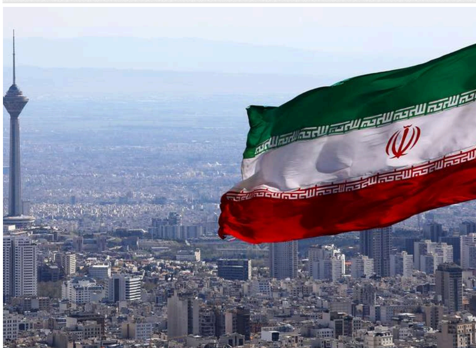
Иран може створити бомбу за 9–12 місяців попри удари США та Ізраїлю, – Reuters

Оцінки розвідки США вказують на те, що час, необхідний Ірану для створення ядерної зброї, не змінився з минулого літа, коли аналітики оцінили, що американо-ізраїльський удар відсунув цей термін на рік.