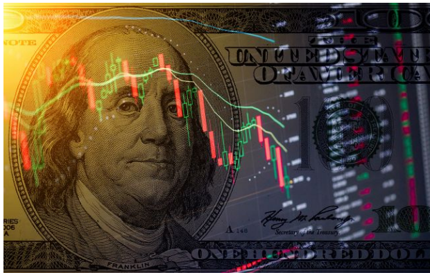
Фото: обмінники та банки оновили курс валют

Ранок понеділка, 20 квітня, зустрів українців новим стрибком цін на іноземну валюту. Після вихідних долар та євро суттєво додали в ціні як у банках, так і в обмінних пунктах.