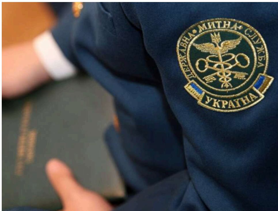
Апеляція замість виправдання: у водія конфіскували люксові Hermes та Chanel на 1,2 мільйона гривень

Апеляція скасувала скандальне рішення: водій мікроавтобуса втратив контрабандні Hermes та Chanel і заплатить понад 600 тисяч гривень штрафу. Історія з «посилками», в яких випадково опинилися люксові сумки та прикраси, отримала несподіваний (або ж цілком закономірний) фінал. Якщо суддя першої інстанції не побачив у діях перевізника контрабанди, то Чернівецький апеляційний суд розставив усе по місцях. Схоже, суддя Олександр Войтун свій Hermes так і не отримав – елітні бренди підуть у дохід держави.