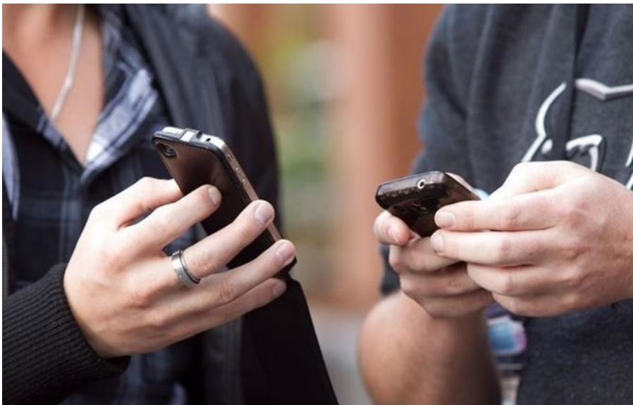
(ілюстративне фото)

Україна демонструє низькі європейського рейтингу інтернет-свободи