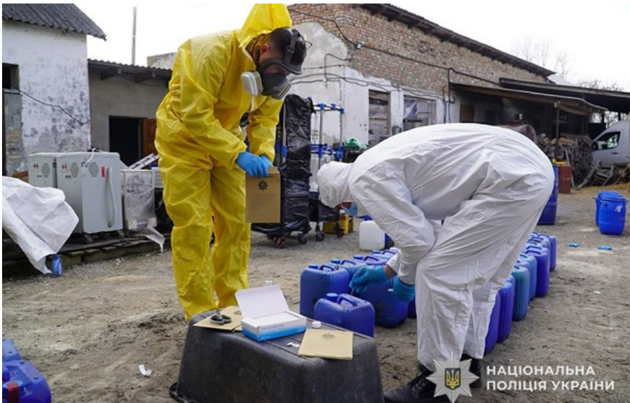
Нарколабораторія діяла на території колишнього агропідприємства

Правоохоронці провели 54 обшуки у семи областях. 12 фігурантам повідомили про підозру, 10 з них затримані.