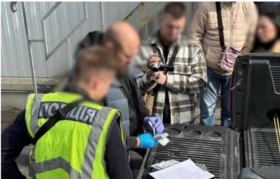
Правоохоронці провели серію санкціонованих обшуків і на території столиці

Вартість таких "послуг" становила 23 тис. доларів з особи; встановлено щонайменше 5 фактів організації "трансферу".