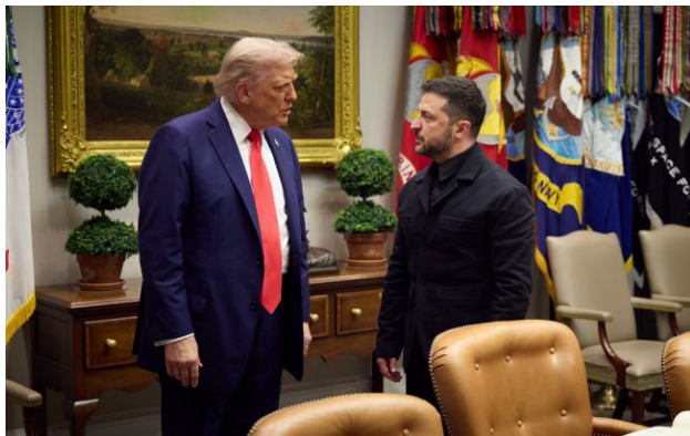
Фото: президент США Дональд Трамп та президент України Володимир Зеленський (president.gov.ua)

Обирайте перевірене - додайте РБК-Україна до улюблених джерел у Google