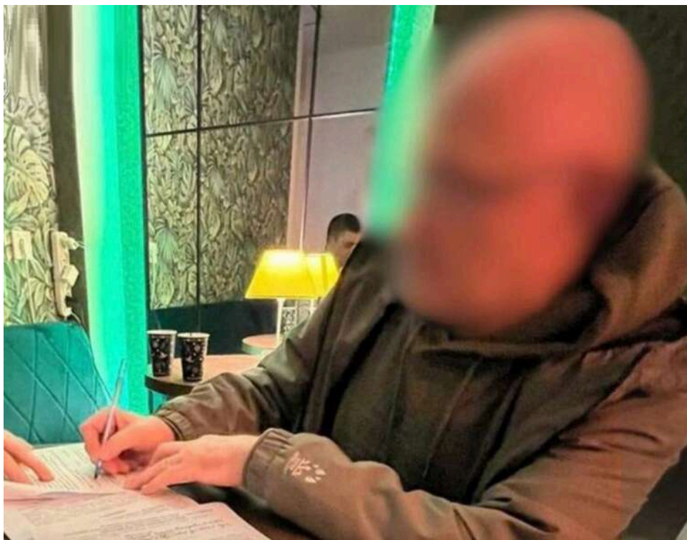
«Зброя майбутнього» проти ракет: у Києві судитимуть ділків, які продали військовому неіснуючу лазерну установку

У Києві до суду скеровано справу двох директорів компанії, які ошукали військовослужбовця на понад 3,2 млн грн, обіцяючи виготовити для нього «лазерну зброю», здатну знищувати БПЛА та балістичні ракети.