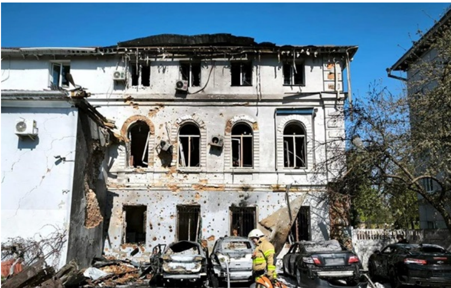
Наслідки російської атаки в Чернігові

Внаслідок атаки пошкоджень та руйнувань зазнала адміністративна будівля, легкові автомобілі.