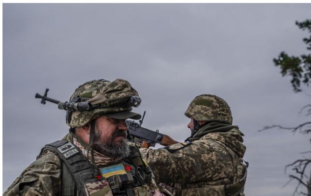
Фото: зафіксовано влучання 28 ударних БПЛА

У ніч на 20 квітня російські окупанти атакували Україну 142 дронами, серед яких були й реактивні "Шахеда". Силам ППО вдалося знешкодити більшість безпілотників, проте є 28 влучань.