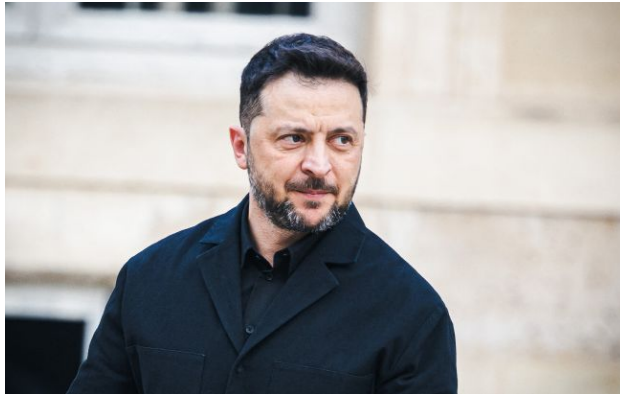
Фото: Володимир Зеленський (Getty Images)

Обирайте перевірене - додайте РБК-Україна до улюблених джерел у Google