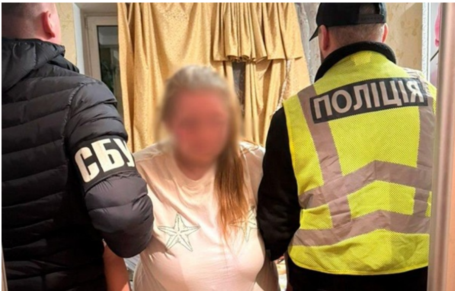
Агентці загрожує довічне ув'язнення з конфіскацією майна

У поле зору росіян мешканка Одеської області потрапила, коли шукала у Телеграм-каналах "швидкі заробітки на дозу".